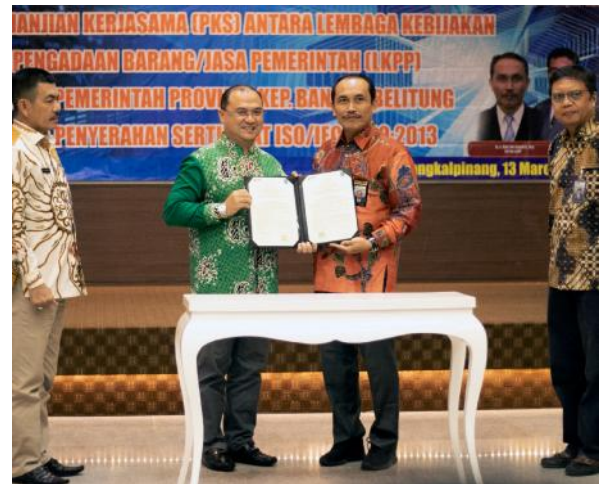
Gubernur menunjukkan kesepakatan yang telah ditandatangani..

Lebih lanjut Gubernur mengungkapkan beberapa kendala yang dialami terkait pengadaan produk lokal. "Kadangkala kami mendapat kesulitan. Pengalaman ini misalnya, saat kami mau mengadakan bibit lada, ini kan khusus, dilelang berapa kali, namun tidak ada yang mau masuk, sedangkan ini penting. Kalau tidak kita lakukan, petani kita sebarang bibit bibit dan dia tidak tahu bibit tersebut sudah sakit. Yang