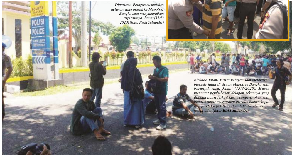
Diperiksa- Petugas memeriksa nelayan yang masuk ke Mapolres Bangka saat menyampaikan aspirasinya, Jumat (13/3/2020).

SUNGAILIAT - Mapolres Bangka, Provinsi Kepulauan Bangka Belitung (Babel) dikepung ratusan warga pesisir Matras, Rebo, Aik Antu, Bedukang, Tuing dan Mapur, Jumat (13/3/2020). Massa menuntut delapan rekannya yang ditahan terkait kasus pengeroyokan saat bentrok masyarakat pro dan kontra kapal isap produksi (KIP) beberapa waktu lalu di wilayah Matras untuk dibebaskan. Terpapantau sejak pukul 09.00 WIB, warga pesisir dengan mayoritas nelayan didukung elemen masyarakat lainnya ini mendatangi Polres Bangka dengan motor dan mobil. Massa juga sempat melakukan blokade jalan di depan Mapolres Bangka sekitar pukul 11.00 WIB. Nelayan meminta profesionalisme polisi yang tak hanya melihat hilir persoalan tetapi juga konflik tambang laut yang bermula dipaksakannya KIP milik mitra. ● ke Hal 11 Kol 1