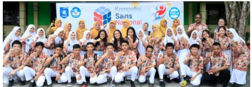
Siswa-siswi SMA Negeri 1 (Smansa) Manggar, Kabupaten Belitung Timur, yang kembali mempertahankan tahta Juara Umum foto bersama. (foto: istimewa).