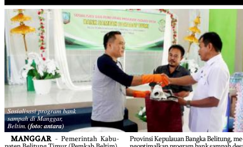
Sosialisasi program bank sampah di Manggar, Belitim.

MANGGAR - Pemerintah Kabupaten Belitung Timur (Pemkab Belitim), Provinsi Kepulauan Bangka Belitung, mengoptimalkan program bank sampah desa