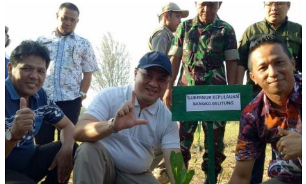
Gubernur melakukan penanaman mangrove di kawasan Pantai Rebo, Jumat (13/3/2020). Kegiatan ini merupakan salah satu rangkaian kegiatan menuju peringatan Hari Mangrove Sedunia.

PANGKALPINANG - Pemerintah Provinsi Kepulauan Bangka Belitung (Babel) dengan Balai Pengelolaan Daerah Aliran Sungai (BPDAS) akan berupaya merehabilitasi lingkungan di kawasan mangrove dan lainnya dengan menanam tanaman jambu mete dan mangrove.