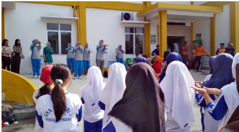
Gerakan enam langkah mencuci tangan dengan bersih kepada para pelajar dan masyarakat di Puskesmas Melintang, Jumat pagi (13/3/2020).

PANGKALPINANG Pemerintah Provinsi Kepulauan Bangka Belitung (Babel) melalui dinas perhubungan mengajak masyarakat untuk mencegah penyebaran virus corona (covid-19) di daerah itu. Salah satu upaya pencegahan dilakukan melalui Gerakan Masyarakat Hidup Sehat (Germas) dengan membersihkan lingkungan secara bergotong-royong. Kelurahan Gajah Mada Kecamatan Rangku, Pangkalpinang dipilih sebagai lokasi aksi bersih lingkungan, karena berada tidak jauh dari kawasan terminal. Selain itu, di tempat ini terdapat pasar dan Puskesmas Melintang. "Mari kita bersama-sama mencegah penyebaran virus corona ini melalui kesadaran dalam perilaku hidup bersih dan sehat, untuk meningkatkan