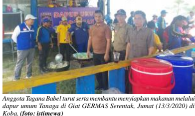
Anggota Tagana Babel turut serta membantu menyiapkan makanan melalui dapur umum Tagana di Giat GERMAS Serentak, Jumat (13/3/2020) di Koba.

sistem yang ada," ungkap Roni Dwi Susanto. Ia mengucapkan selamat atas pencapaian ini, dan semoga menjadi suatu pemacu buat instansi untuk berkembang lebih baik lagi dalam memberikan kepastian kepada publik pengguna sistem bahwa sistem yang dipakai adalah aman dan terpercaya. (rell/3)