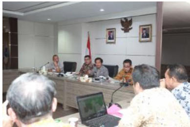
Wagub ketika memimpin rapat terkait persiapan pembangunan Jembatan Nibung di Desa Nibung, Kabupaten Bangka Tengah. Babel.