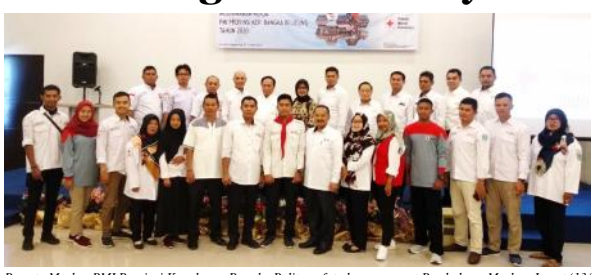
Peserta Musker PMI Provinsi Kepulauan Bangka Belitung foto bersama saat Pembukaan Musker, Jumat (13/3/2020) di SUN Hotel, Pangkalpinang.