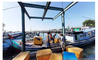
Aktivitas pembongkaran ikan oleh nelayan di Belitung

BELITUNG - Para nelayan di Kabupaten Belitung, Provinsi Kepulauan Bangka Belitung, saat ini sedang memanen hasil tangkapan berupa ikan tongkol dan tenggiri sehingga mendorong jumlah tangkapan nelayan di daerah itu. "Kalau sekarang ini sedang musimnya ikan tongkol dan tenggiri karena fase bulan gelap sehingga ikan tongkol dan tenggiri cukup banyak," kata salah seorang nelayan jaring, Nedi di Pelabuhan Perikanan Nusantara (PPN) Tanjung Pandan, Kamis. Menurut dia, dalam sekali melaut selama empat hingga lima hari jumlah tangkapan ikan tongkol dan tenggiri dapat mencapai 400 kilogram.