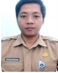
ALAM rangka meningkatkan profesionalisme guru...

Guru SMA Negeri 1 Pemali Kab. Bangka, Bangka Belitung