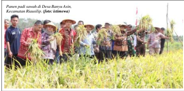
Panen padi sawah di Desa Banyu Asin, Kecamatan Riausilip.