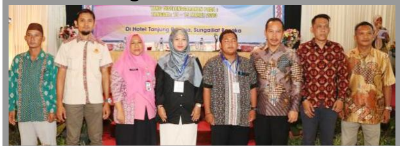
Peserta pelatihan Sipades bersama narasumber dan pejabat Pemkab Bangka di Hotel Tanjung Pesona Sungailiat, Jumat (13/3/2020).

SUNGAILIAT - Guna mewujudkan tata kelola pemerintahan desa yang akuntabel dan transparan, para pejabat desa diharapkan memahami akan mekanisme pengelolaan aset desa. Melalui pelatihan aplikasi SIPADES (Sistem Pengelolaan Aset Desa) yang diselenggarakan Pemkab Bangka diharapkan mampu mendukung hal tersebut. Sebanyak 124 orang aparat pemerintah desa se-Kabupaten Bangka menerima pelatihan selama tiga hari di Hotel Tanjung Pesona Sungailiat. Dengan para narasumber yang berkompeten