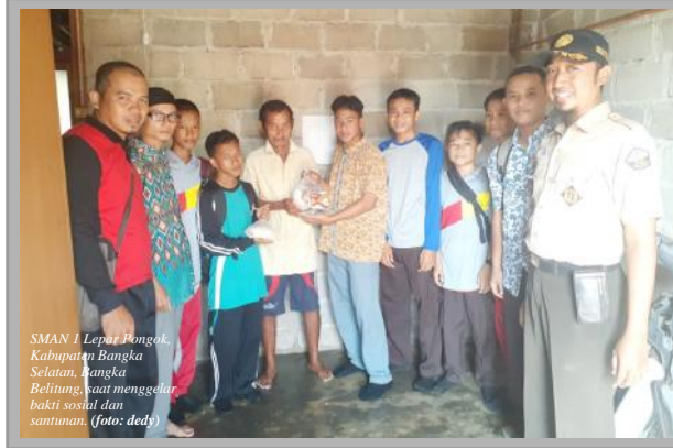
SMAN 1 Lepong Pongok, Kabupaten Bangka Selatan, Bangka Belitung, saat menggelar bakti sosial dan santunan

►► Raih Medali Emas & Perunggu di KSN Basel