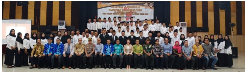
Anggota Panitia Pengawas Pemilihan Umum Kelurahan/Desa se-Kabupaten Bangka Tengah foto bersama usai dilantik di Grand Vella Hotel Pangkalan Baru, Sabtu (14/03/2020).

"Koordinasi lintas sektor ini agar bisa memiliki pandangan sama dan mampu bersama-sama melakukan pencegahan dan penanganan," imbuhnya. (ant/3).