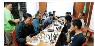
Atlet Catur Bangka Selatan sedang mengikuti seleksi untuk mengikuti ajang Kejuda Babel 2020, Kejurnas Junior Belitung Bulan Juni dan Juli 2020 serta event lain tingkat Nasional 2020.

Untuk itu Sahirin berharap, kepada seluruh Panwaslu Kelurahan/Desa terpilih untuk dapat melaksanakan tugas-tugas pengawasan sebagaimana yang diamanatkan Undang-Undang. (raw/3)