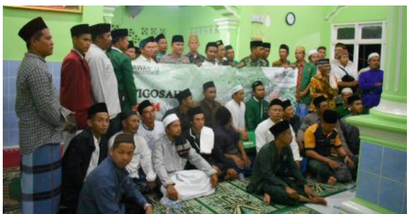
Jaajaran Bawaslu dan Pengurus NU Basel foto bersama.

"Kami mengajak masyarakat untuk mengawal dan mengawasi Pemilihan Bupati dan Wakil Bupati Kabupaten Bangka Selatan Tahun 2020, dan