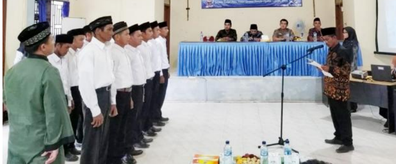
53 Anggota Panwaslu Kelurahan/Desa se-Kabupaten Bangka Selatan saat ditantik dan diambil sumpahnya.