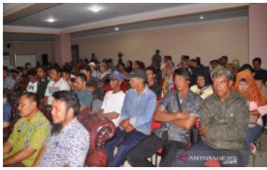
224 nelayan di Kabupaten Belitung Timur yang mendapatkan bantuan ketika diberikan pengarahan oleh Bupati Belitung Timur.