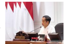
yang tersebar secara proporsional pada 123 desa/kelurahan terpilih di 34 provinsi seluruh Indonesia. (ant)

Responden dalam survei tersebut adalah penduduk Indonesia yang berumur minimal 17 tahun atau sudah menikah. Proporsi responden laki-laki dan perempuan sebesar 50:50 persen