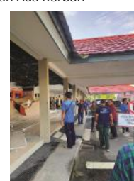
Warga dan calon penumpang pesawat melihat plafon area pintu keluar ruang kedatangan domestik Bandara Internasional H.A.S. Hanajoeddin Tanjungpandan, yang ambruk, Minggu pagi (15/3/2020).

TANJUNGPANDAN - Para calon penumpang pesawat yang berada di bandara H.A.S.Hanajoeddin Tanjungpandan Kabupaten Belitung Provinsi Bangka Belitung, pada Minggu (15/3/2020) sontak terkejut ke Hal 11 Kol 5