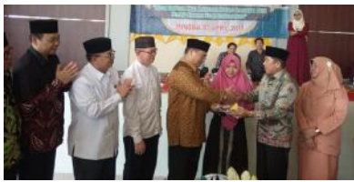
suara untuk lebih memajukan prestasi, baik akademik maupun non akademik. "Dalam rangka milad yang pertama ini, mari bersama-sama untuk mempersiapkan dan memajukan kampus kita tercinta. Kedepannya, masih banyak yang harus kita siapkan baik dari segi administrasi, keuangan, maupun infrastruktur agar kita bisa menyempatkan