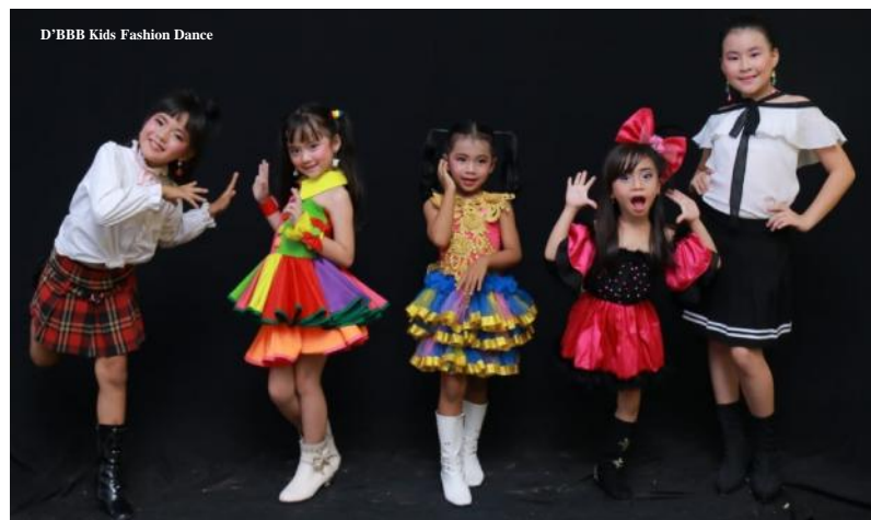
D'BBB Kids Fashion Dance