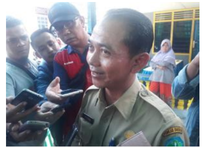
kami langsung pergi ke TPS untuk mencoblos sama seperti pilkada kemarin," ungkap Mulkan.

Setelah menggunakan hak pilihnya, ia berencana untuk keliling memantau langsung proses pemilihan di TPS-TPS