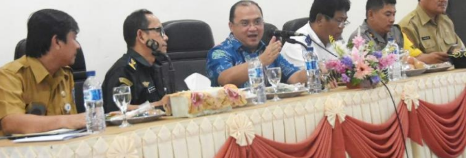
Gubernur Babel, Erzaldi Rosman, saat menghadiri Rapat Koordinasi (Rakor) terkait Perizinan dan Pendistribusian BBM Bersubsidi Bagi Nelayan di Balai Pertemuan Nelayan Pelabuhan Perikanan Nusantara Sungailiat, Kabupaten Bangka, Selasa (16/4/2019) siang.

di wilayah kepulauan dan kedua di daratan, semuanya sudah diterima. Kita berdo'a bersama, agar Pemilu serentak khususnya di Babel berjalan dengan aman, damai, jujur dan adil tentunya," kata Amri. Terpisah, KPUD Babel pada Selasa malam, juga melakukan pemusnahan logistik yang tidak terpakai atau rusak. Pemusnahan dilakukan di halaman Kantor KPUD Babel. (raw/3)