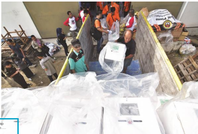
DISTRIBUSI LOGISTIK – Lantaran memiliki wilayah yang dekat, KPU Kota Pangkalpinang baru kemarin melakukan distribusi logistik Pemilu Serentak 17 April 2019. Logistik yang terdiri dari kertas suara, bilik dan kotak suara itu diangkut 13 truk keliling Pangkalpinang. Tadi malam logistik ini sudah berada di kantor-kantor kelurahan dan subuh tadi mulai diambil para KPSS, dibawa ke TPS untuk dicoblos para pemilih hari ini.

Hanya saja, Erik masih enggan menyebutkan secara detail identitas terlapor serta siapa calon legislatif yang menyuruh. ● ke Hal 11 Kol 5