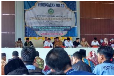
Perayaan milad pertama Institut Agama Islam Negeri Syekh Abdurahman Siddik di Aula Gedung Terpadu di Desa Petaling, Kecamatan Mendo Barat, Selasa (16/4/2019).