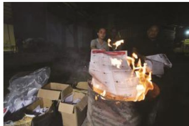
Surat suara yang rusak di KPU Kota Pangkalpinang, tadi malam dimusnahkan dengan cara dibakar di Gudang Jelutung Subur, Pangkalpinang. Dari 6.047 lembar surat suara rusak, yang dibakar paling banyak adalah surat suara DPRD Provinsi Babel. KPU daerah lain di Babel juga melakukan hal serupa kemarin siang.

dimusnahkan tersebut merupakan surat suara yang rusak dan kelebihan. Surat suara tersebut meliputi surat-suara ● ke Hal 11 Kol 1