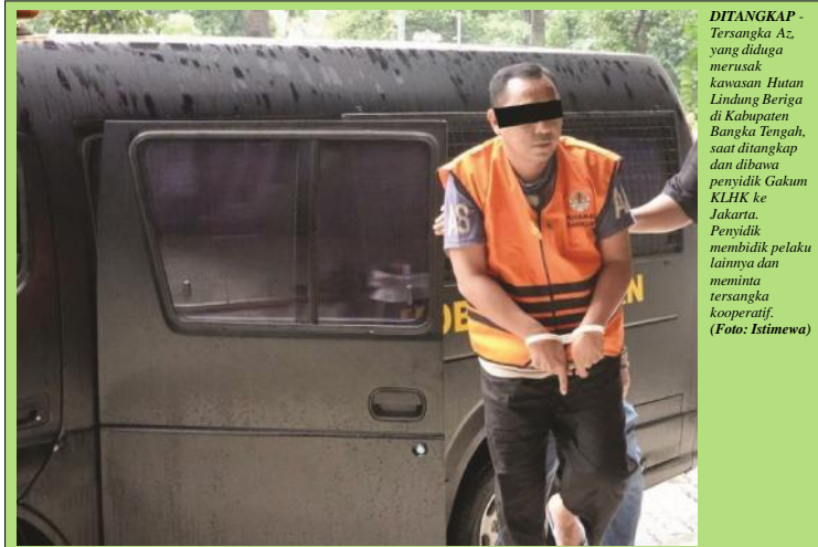
DITANGKAP - Tersangka Az, yang diduga merusak kawasan Hutan Lindung Beriga di Kabupaten Bangka Tengah, saat ditangkap dan dibawa penyidik Gakum KLHK ke Jakarta. Penyidik membidik pelaku lainnya dan meminta tersangka kooperatif.

Senin PNS Dirumahkan Kebijakan lain yang diambil, Walikota memberikan keputusan PNS di lingkungan Pemkot Pangkalpinang diberlakukan dan dirumahkan selama 14 hari ke depan. ● ke Hal 11 Kol 5