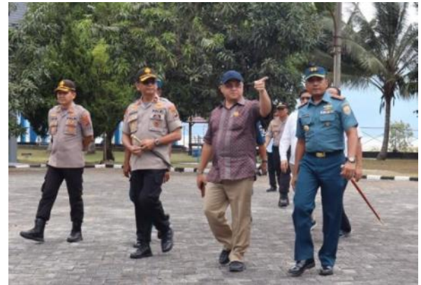
Gubernur bersama Kapolda saat mengunjungi Mako Lanal Babel di Belinyu.

Lebih lanjut dikatakan Danlanal, hand sanitizer yang diproduksi sendiri oleh mako yang sudah merupakan produk yang diproduksi sendiri oleh