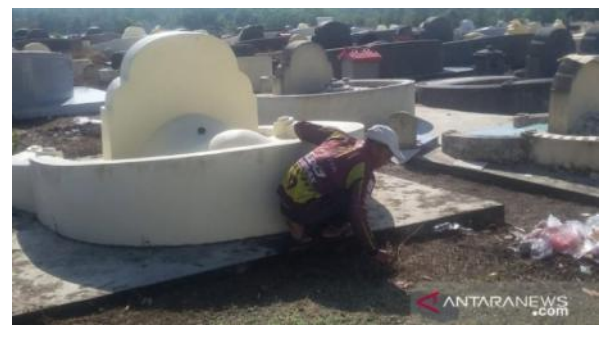
Seorang petugas sedang membersihkan pemakaman leluhur warga keturunan yang ada di Belitung.

"Cheng beng dimulai tanggal 5 Maret sampai tanggal 4 April sedangkan puncaknya tanggal 26 sampai 29 Maret," tutur-