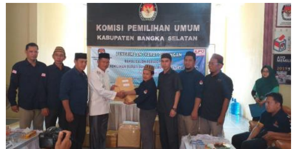
Pasangan KORI saat menyerahkan berkas pencalonan independen ke KPUDBasel.

Sebelumnya, setelah proses verifikasi administrasi, ada 2 tahapan yang akan dilalui yaitu verifikasi administrasi dan faktual. Bila hasilnya memenuhi syarat, maka lanjut lagi pendaftaran pada masa yang sama