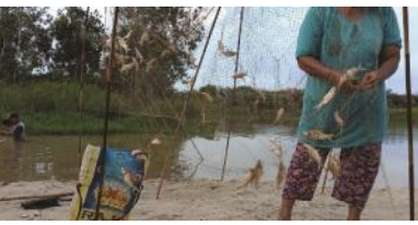
Warga menajring ikan-ikan di sungai Desa Pangkal Buluh yang mati karena diduga tercemar limbah pabrik tapioka CV SBM. Badan warga juga terasa gatal-gatal setelah mandi di sungai itu.

PAYUNG - Warga Desa Pangkal Buluh, Kecamatan Payung, Kabupaten Bangka Selatan, Provinsi Kepulauan Bangka Belitung mengeluhkan banyaknya ikan di sungai desa itu mati tiba-tiba. Selain itu, di beberapa titik terdapat bau air sungai yang menyengat.