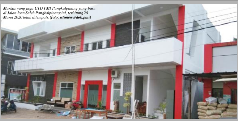
Markas yang juga UTD PMI Pangkalpinang yang baru di Jalan Ican Saleh Pangkalpinang ini, terhitung 20 Maret 2020 telah ditempati.

“Kepada masyarakat yang berhubungan dengan layanan darah, silakan langsung ke PMI Pangkalpinang di Jalan Ican Saleh No 88, atau persis disebelah BPJS Kesehatan Pangkalpinang,” ujar Wahyono. Atas nama Pengurus PMI Pangkalpinang, Wahyono mengucapkan terima kasih atas dukungan dan doa seluruh masyarakat Pangkalpinang, sehingga gedung PMI Pangkalpinang yang baru bisa selesai dan dapat ditempati. “Semoga dengan gedung baru ini, mampu menambah mutu layanan kepada masyarakat,” harap Wahyono. (vip/3)