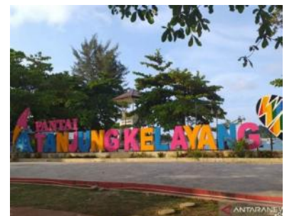
Pantai Wisata Tanjung Kelayang ini, oleh Pemkab Belitung ditutup sementara dari pengunjung, untuk mencegah penyebaran Covid-19.

Sedangkan untuk kunjungan wisatawan ke daerah itu hingga sejauh ini menurun akibat dampak COVID-19. "Jumlah wisatawan dengan adanya ini menurun drastis