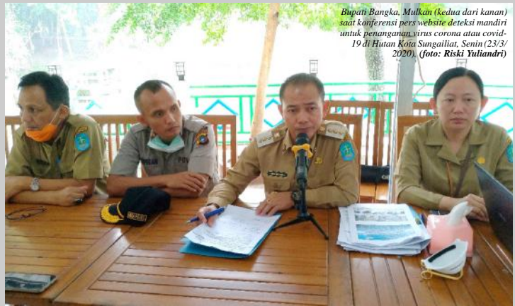
Bupati Bangka, Mulkan (kedua dari kanan) saat konferensi pers website deteksi mandiri untuk penanganan virus corona atau covid-19 di Hutan Kota Sungailiat, Senin (23/3/2020).

"Dengan mengisi data tersebut tentu dapat membantu pemerintah dalam menanggulangi kemungkinan ter-sebarnya virus corona ini. Kita juga berharap dengan ini bisa menjangkir seluas mungkin potensi covid-19 di Kabupaten Bangka," jelasnya.