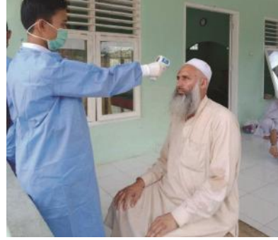
Salah seorang dari delapan WNA asal Pakistan diperiksa suhu tubuhnya terkait Corona di Desa Perpat, Membalong, Belitung, kemarin dan hasilnya negatif.

tim medis Puskesmas Membalong. Saat mendapat kabar rombongan WNA itu berada di Desa Perpat, tim medis mengempiri dan melakukan pemeriksaan kesehatan terhadap mereka, Senin (23/3/2020). ● ke Hal 11 Kol 5