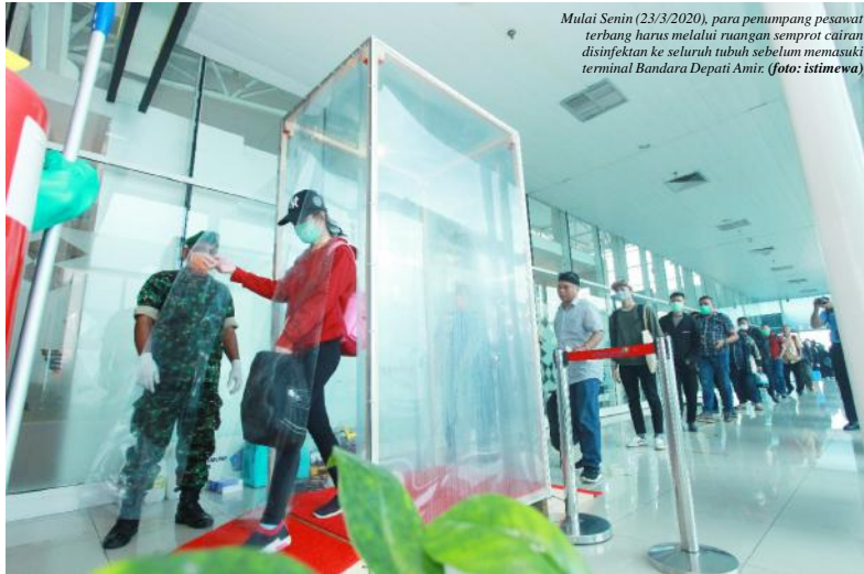
Mulai Senin (23/3/2020), para penumpang pesawat terbang harus melalui ruangan semprot cairan disinfektan ke seluruh tubuh sebelum memasuki terminal Bandara Depati Amir.