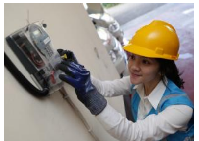
Petugas PLN mengecek meteran listrik pelanggan.

penghemat listrik dapat memperburuk faktor daya dan justru akan memperbesar energi terukur. "Jadi alat penghemat listrik hampir pasti tidak bisa mengurangi tagihan listrik," tegas Dwi. Mengapa tidak bisa? lanjut dia, karena alat tersebut mengurangi arus atau mengurangi energi reaktif (VAr), bukan energi aktif (Watt), sementara yang dibayar konsumen adalah energi aktif (Watt) dikali waktu, yang satuannya kilo Watt-Jam, atau kWh. "Lalu, mengapa jawabannya hampir pasti tidak bisa? Ya, karena untuk pelanggan tertentu khususnya berdaya terpasang yang besar, PLN membatasi penggunaan energi reaktif (kVArh) dengan memasang kVArh-meter. Artinya apabila pelanggan memakai lebih dari batas daya reaktif yang dikonsumsi, akan dikenakan biaya yang diukur oleh kVArh," jelas Dwi. "Sehingga penggunaan alat hemat listrik yang dipromosikan ini, bisa saja memang dapat mengurangi kompensasi kelebihan kVArh namun harus