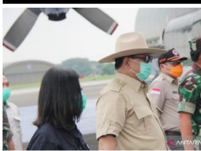
JAKARTA - Menteri Pertahanan Prabowo Subianto menyebutkan, dirinya mendapatkan tawaran dari Menteri Pertahanan China terkait bantuan untuk penanganan COVID-19. "Saya sendiri sudah berkomunikasi

dengan Menhan Tiongkok, beliau menanyakan kebutuhan kita apa? Saya sudah kirim daftar, tapi entah apa yang dipenuhi nanti," kata Prabowo di Lanud Halim Perdanakusuma, Jakarta, Senin (23/3). Menurut dia, hal ini merupakan salah satu wujud kerja sama internasional, terutama dengan China. Oleh karena itu, Prabowo menyambut baik tawaran tersebut. Terlebih, China sudah berpengalaman dalam menghadapi gelombang dahsyat COVID-19. "Ini merupakan bentuk kerja sama internasional. Mereka sudah lewat gelombang dahsyat COVID-19, jadi mereka tawarkan kepada kita, kita sambut," kata mantan Danjen Kopasus ini. Prabowo menyebutkan, salah satu alat kesehatan yang masih dibutuhkan Indonesia untuk menangani COVID-19 adalah ventilator atau alat bantu