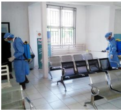
Petugas menyemprot cairan disinfektan di ruang tunggu pasien RSUD DH.