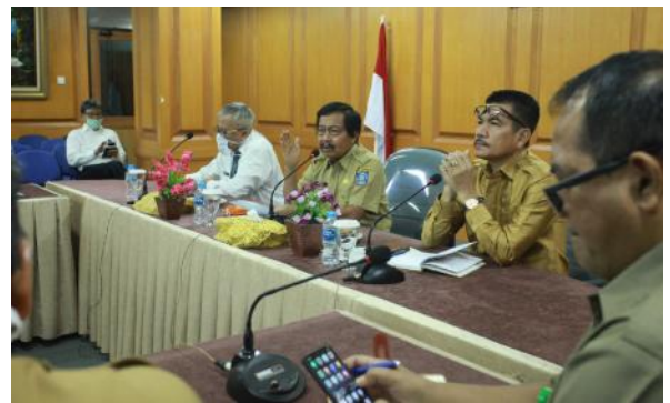
Wagub Babel Abdul Fatah memimpin Rapat Pembahasan Pengadaan Alat Kesehatan Terkait Penanganan Covid-19, Senin (23/3/2020).

Rapat ini, turut dihadiri Kepala BPKP Babel, Ikhwani Mulyawan, perwakilan Kejati