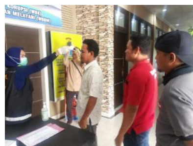
Wartawan Bangka Tengah ketika memeriksa suhu tubuh ke Petugas Kesehatan Polres Bangka Tengah, Senin (23/03/2020).

Ia mengimbau kepada wartawan untuk menjaga kesehatan dan mematuhi aturan