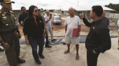
Para anggota DPRD Basel didampingi Sat Pol PP ketika sidak melihat pembangunan tambak udang di Pantai Tanjung Kerasak, Bangka Selatan, kemarin. Sorenya dewan lapor polisi.

TOBALI - Setelah melakukan sidak ke tambak udang PT Sadai Jaya Lestari di Pantai Tanjung Kerasak, Kecamatan Tukak Sadai, Kabupaten Bangka Selatan (Basel), Provinsi Kepulauan Bangka Belitung, para anggota DPRD Basel yang terdiri dari lintas Komisi dan Fraksi mengaudikan aktivitas pembangunan tambak udang itu yang diduga tak mengantongi izin ke Polres Basel, Senin (23/3/2020). Pengaudian ini hanya bersifat konsultasi serta meminta pertimbangan hukum atas hasil sidak yang dilakukan anggota DPRD Basel. "Ini hanya pengaudian saja, kita konsultasi ● ke Hal 11 Kol 5