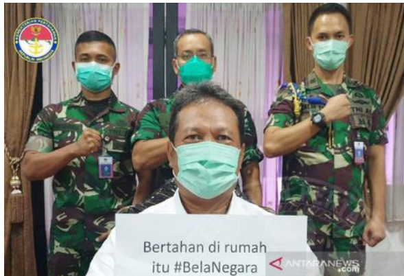
Rumah Sakit TNI AL Minto-hardjo, dan Rumah Sakit TNI AU dr Esnawan Antarkisa. Selain itu, Kemanjuga telah mendistribusikan peralatan disinfektan kepada Mabes TNI AD, Mabes AL, dan Mabes AU, BA-IS, Puspom AU, Koopsau, Kementerian KPPA, Istana Kepresidenan, Istana Wapres, Kementerian Koordinator PMK, Kodam Jaya dan Kormar serta Kohadimad. Peralatan yang didistribusikan antara lain berupa tenda atau ruang pemeriksaan temperatur dan penyemprotan disinfektan beserta "box sprayer", serta serbuk disinfektan yang digunakan untuk penyemprotan setiap orang dan juga kendaraan sebagai upaya tindakan preventif mencegah dan menekan penyebaran COVID-19. (ant)

JAKARTA - Wakil Menteri Pertahanan Sakti Wahyu Trenggono mengingatkan masyarakat yang menjalankan "social distancing", termasuk bertahan di rumah untuk menekan penyebaran virus Corona merupakan bagian dari bela negara. "Social distancing" dengan menjalankan skema bekerja dari rumah (work from home) dan belajar dari rumah itu adalah bagian dari menekan penyebaran virus," katanya, melalui pernyataan tertulis, di Jakarta, Senin (23/3). Menurut dia, "social distancing" harus dijalankan dengan disiplin selama masa status darurat bencana hingga 29 Mei 2020 agar Indonesia bisa terbebas dari virus Corona. "Jadi, sekarang bertahan di rumah itu Bela Negara," kata Wamenhan, di rumah dinasny di Jakarta. Trenggono menjelaskan skema bekerja dan belajar dari rumah itu sudah dilakukan karena infrastruktur digital seperti layanan 4G penetrasinya sudah mencapai 90 persen dari total populasi Indonesia. "Pak Jokowi sudah bangun tol langit yang mendukung 4G