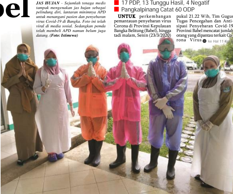
JAS HUJAN - Sejumlah tenaga medis tampak mengenakan jas hujan sebagai pelindung diri, lantaran minimnya APD untuk menangani pasien dan penyebaran virus Covid-19 di Bangka. Foto ini telah viral di media sosial. Sedangkan penda telah membeli APD namun belum juga datang.