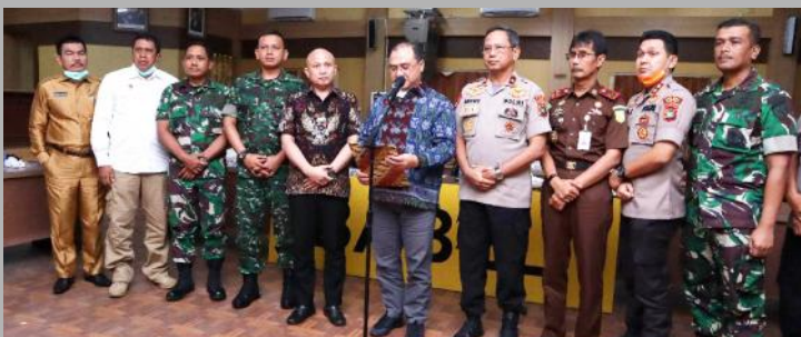
Gubernur bersama unsur Forkopimda Babel membacakan 10 seruan terkait percepatan penanganan penyebaran Covid-19 saat Covid dengan Bupati/Walikota se Babel.

Keenam, Hindari kontak fisik langsung dengan lawan bicara/orang lain serta tidak berdekatan dengan orang sakit dan hewan, sebagai upaya mencegah Corona Virus Disease (Covid 19); Ketu-