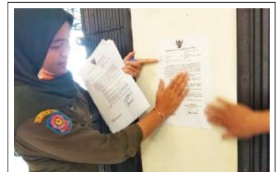
Anggota Pol PP Babel menempelkan imbauan Gubernur Babel terkait pencegahan Covid-19.

Untuk itu, ditegaskan Gubernur Erzaldi, Pemprov Babel mulai sekarang melakukan gerak cepat dalam mengantisipasi penyebaran Covid-19, sehingga Kepulauan Bangka Belitung benar-benar aman dan ekonomi masyarakat kembali membaik. (rel/3)